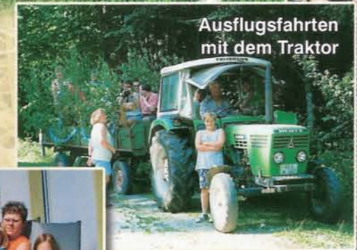
Ausflugsfahrten mit dem Traktor