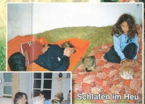
Schlafen im Heu