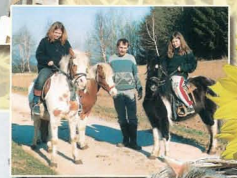
Grillabende im Hof