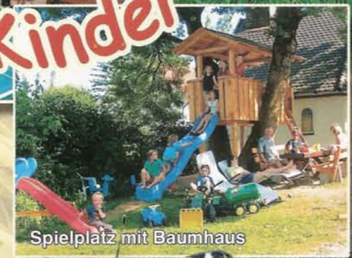
Spielplatz mit Baumhaus